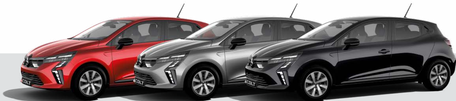
Metalizowany Sunrise Red - NNP ▲