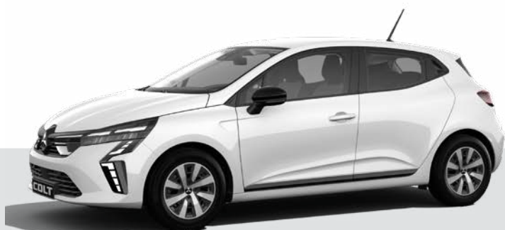
Niemetalizowany Artic White - 369 ▲