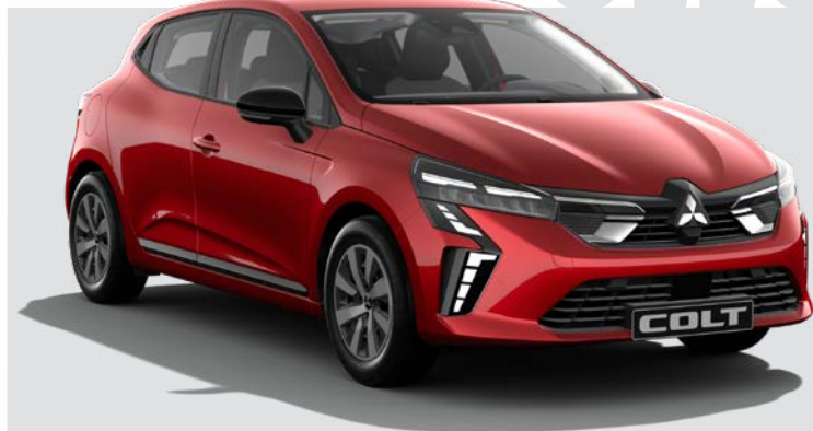
1.0T LPG Invite