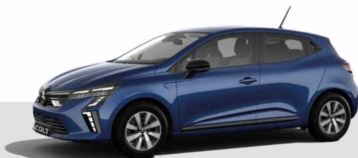
Metalizowany Royal Blue - RQH ▲