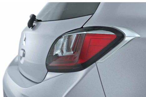
RAMKI LAMP TYLNYCH, CHROMOWANE nr kat. MZ331411