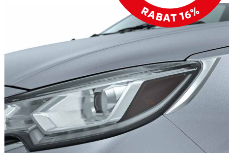
RAMKI LAMP PRZEDNICH, CHROMOWANE nr kat. MZ331410