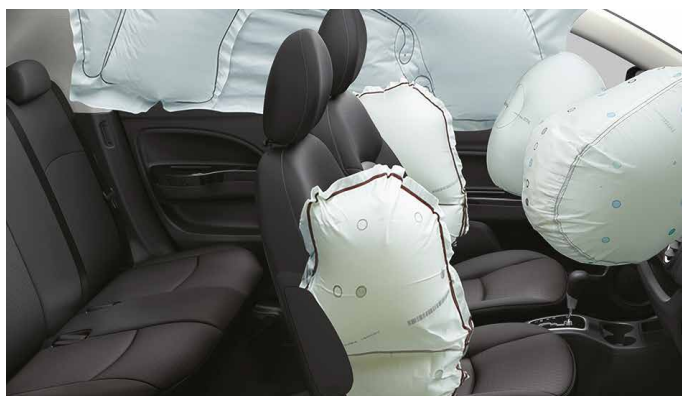
6 PODUSZEK POWIETRZNYCH W STANDARDZIE