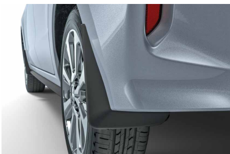
CHLAPACZE TYLNE nr kat. MZ331403