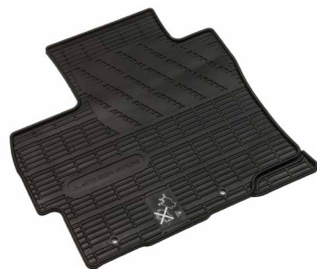
DYWANIKI GUMOWE nr kat. MZ314721

* Do wersji bez schowka pod podłogą bagażnika ** Do wersji ze schowkiem pod podłogą bagażnika