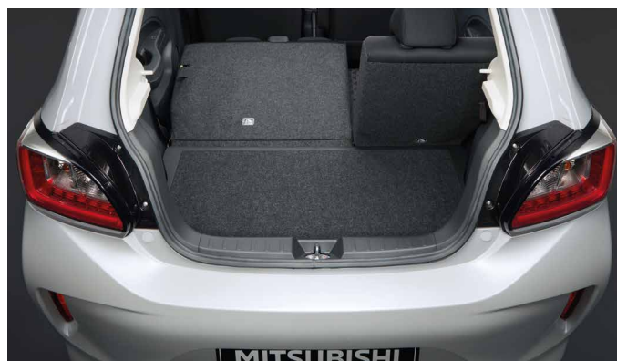
OPARCIE TYLNEJ KANAPY SKŁADANE W PROPORCJACH 60:40