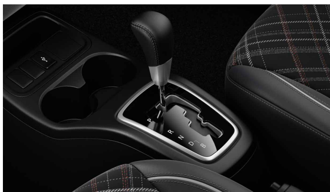
AUTOMATYCZNA SKRZYŃNIA BIEGÓW