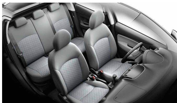
JASNOSZARA TAPICERKA TEKSTYLNA