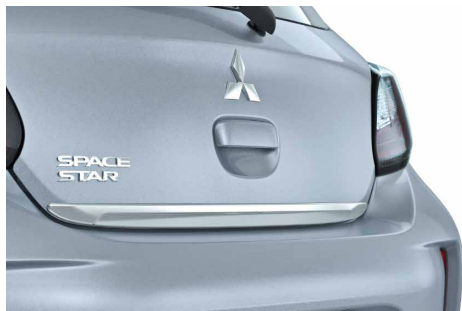
LISTWA POKRYWY BAGAŻNIKA, CHROMOWANA nr kat. MZ330461