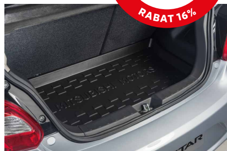
KUWETA BAGAŻNIKA nr kat. MZ330446*/MZ331113**