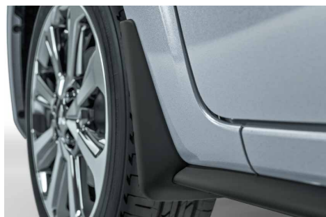
CHLAPACZE PRZEDNIE nr kat. MZ331402