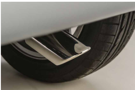
KOŃCÓWKA RURY WYDECHOWEJ, CHROMOWANA nr kat. MZ330438