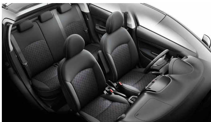
CZARNA TAPICERKA TEKSTYLNA