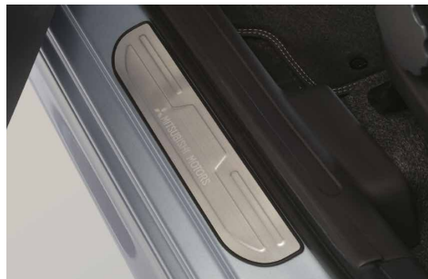
NAKŁADKI PROGOWE, STAL NIERDZEWNA