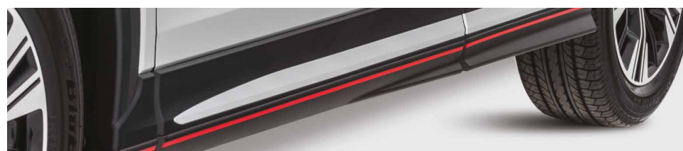
LISTWY PROGOWE nr kat. MZ576677EX