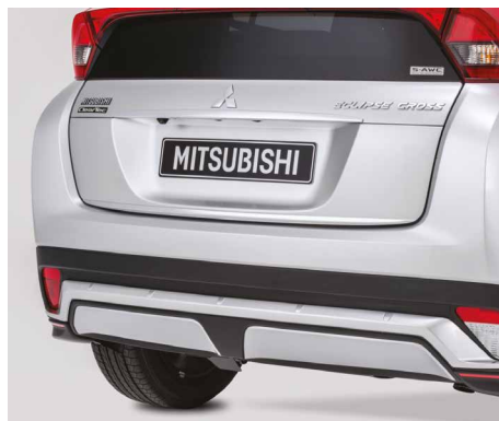
LISTWA OZDOBNA ZDERZAKA TYLNEGO nr kat. MZ576675EX