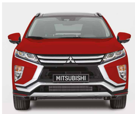
LISTWA OZDOBNA ZDERZAKA PRZEDNIEGO nr kat. MZ576673EX

PAKIET DYNAMIC ELEGANCE PROMOCYJNA CENA DETALICZNA 3 481 zł (brutto) RABAT 12%