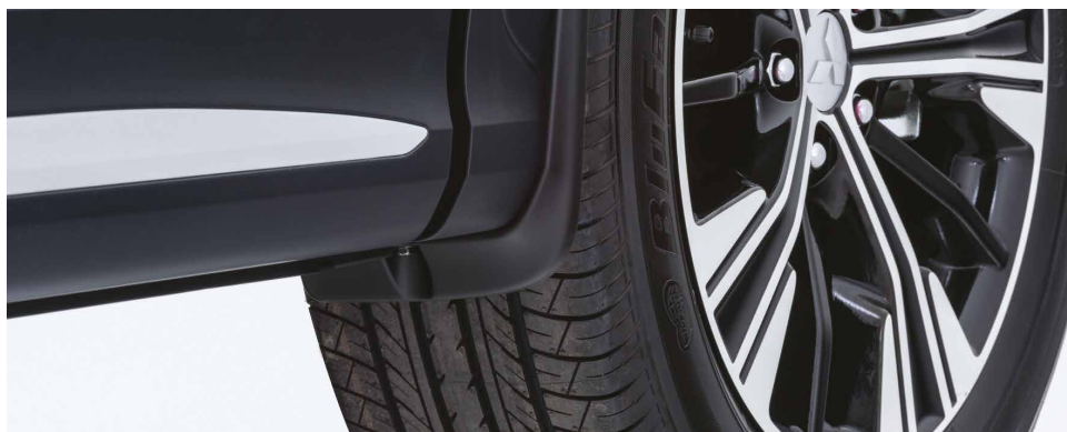
KPL. CHLAPACZY PRZEDNICH nr kat. MZ531447EX

PAKIET PROTECTION PROMOCYJNA CENA DETALICZNA 949 zł (brutto) RABAT 21%