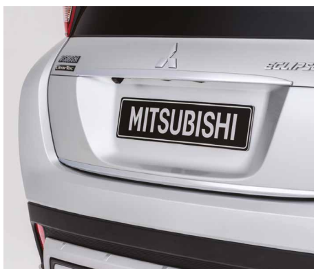
LISTWA POKRYWY BAGAŻNIKA nr kat. MZ576678EX