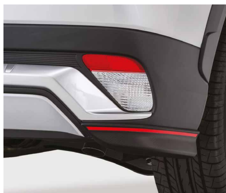
OZDOBNE NAROŻNIKI ZDERZAKA TYLNEGO nr kat. MZ576676EX