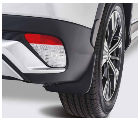
KPL. CHLAPACZY TYLNYCH nr kat. MZ531448EX