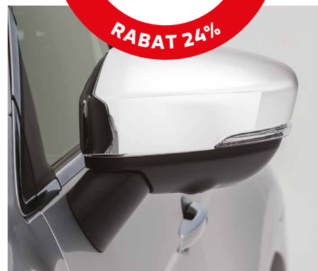
OSŁONY LUSTEREK, CHROMOWANE nr kat. MZ576689EX