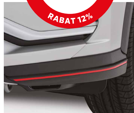
OZDOBNE NAROŻNIKI ZDERZAKA PRZEDNIEGO nr kat. MZ576674EX