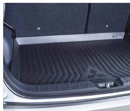
KUWETA BAGAŻNIKA nr kat. MZ314980