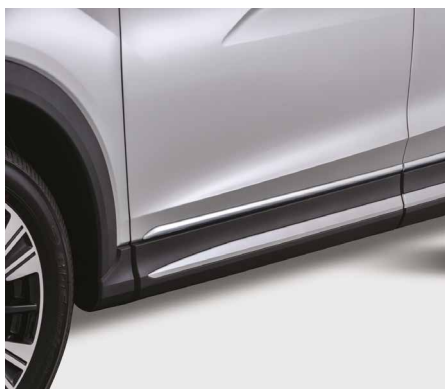
BOCZNE LISTWY OZDOBNE, CHROMOWANE nr kat. MZ538346EX

PAKIET DYNAMIC ELEGANCE PROMOCYJNA CENA DETALICZNA 1 499 zł (brutto) RABAT 24%