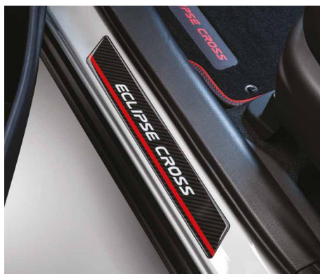
NAKLADKI PROGOWE WZÓR "CARBON" nr kat. MZ315066