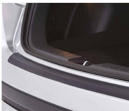
NAKLADKA OCHRONNA ZDERZAKA TYLNEGO nr kat. MZ576679EX