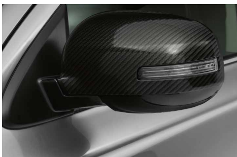
OSŁONY LUSTEREK ZEWNĘTRZNYCH, WZÓR CARBON