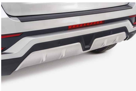
OSŁONA ZDERZAKA TYLNEGO