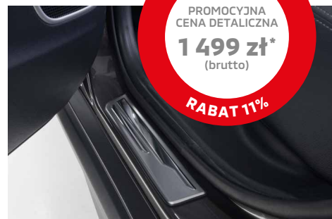
NAKŁADKI PROGOWE, STAL NIERDZEWNA