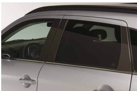
FOLIA DEKORACYJNA NA SŁUPKI B/C, WZÓR CARBON