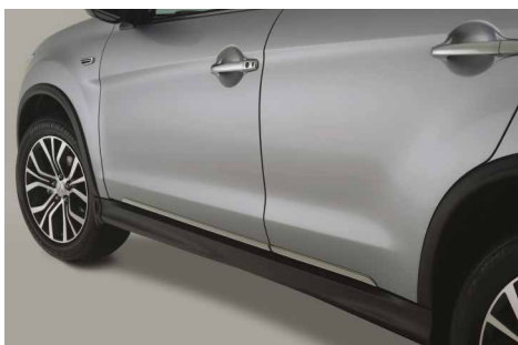
CHROMOWANE DOLNE LISTWY OZDOBNE