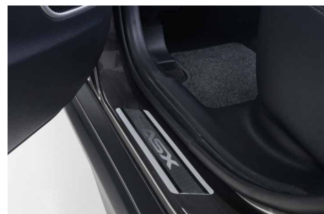
NAKŁADKI PROGOWE, SZARE