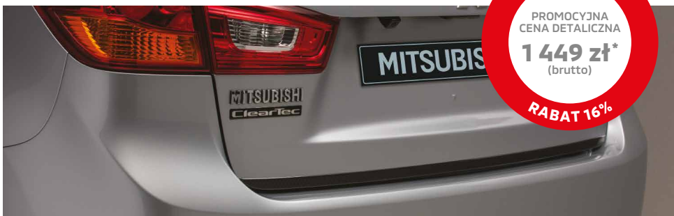
LISTWA POKRYWY BAGAŻNIKA, WZÓR CARBON

* do wersji bez kierunkowskazów w lusterkach