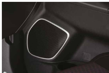
RAMKI GŁOŚNIKÓW, KOLOR ALUMINIUM