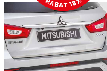
LISTWA POKRYWY BAGAŻNIKA, KOLOR ALUMINIUM