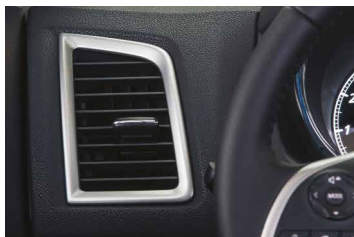
RAMKI NAWIEWÓW POWIETRZA, KOLOR ALUMINIUM