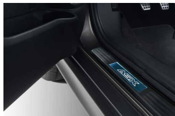
PODŚWIETLANE NAKŁADKI PROGOWE