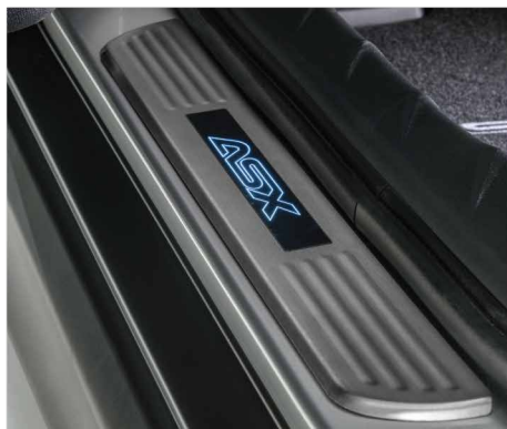
PODŚWIETLANE NAKŁADKI PROGOWE nr kat. MZ314484