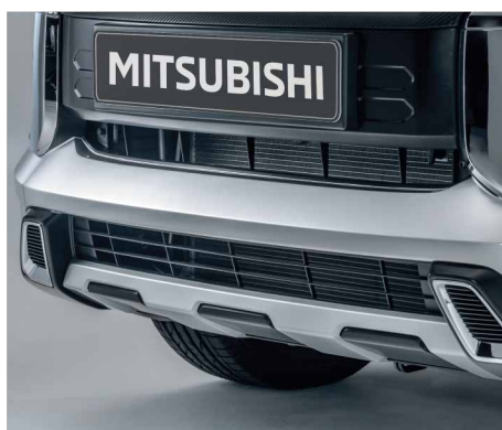
OSŁONA ZDERZAKA PRZEDNIEGO, DOLNA nr kat. MZ576764EX