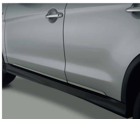
CHROMOWANE DOLNE LISTWY OZDOBNE nr kat. MZ314598