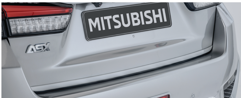
LISTWA POKRYWY BAGAŻNIKA, KOLOR ALUMINIUM nr kat. MZ314434