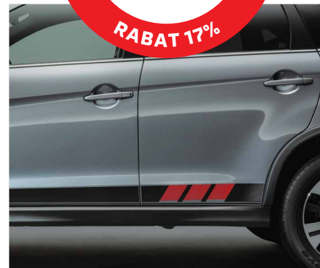
FOLIE BOCZNE nr kat. MZ553168EX