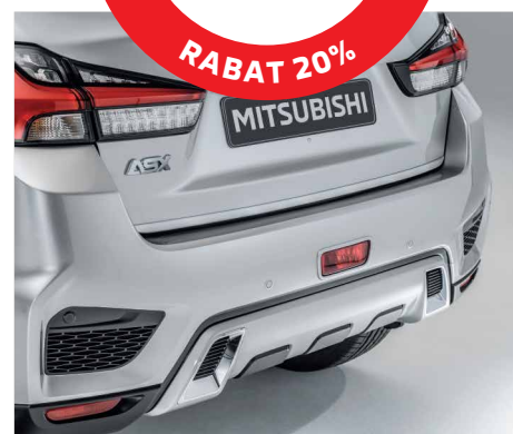
OSŁONA ZDERZAKA TYLNEGO, DOLNA nr kat. MZ576765EX