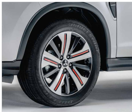
PASKI OZDOBNE NA FELGI 18" nr kat. MZ553165EX