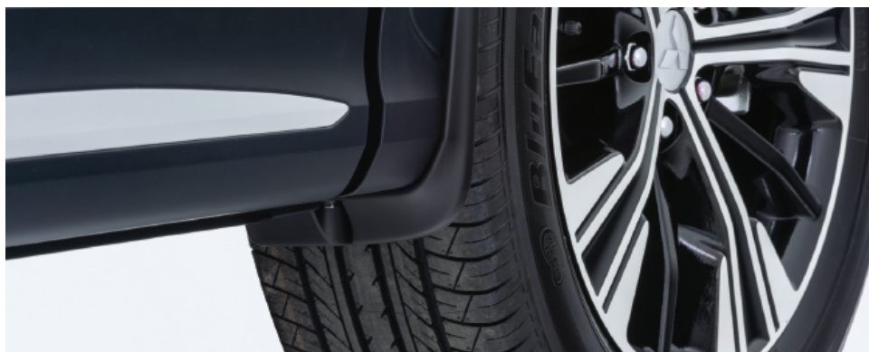
KPL. CHLAPACZY PRZEDNICH nr kat. MZ531447EX