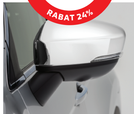
OSŁONY LUSTEREK, CHROMOWANE nr kat. MZ576689EX