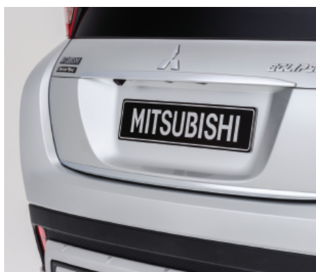
LISTWA POKRYWY BAGAŻNIKA nr kat. MZ576678EX