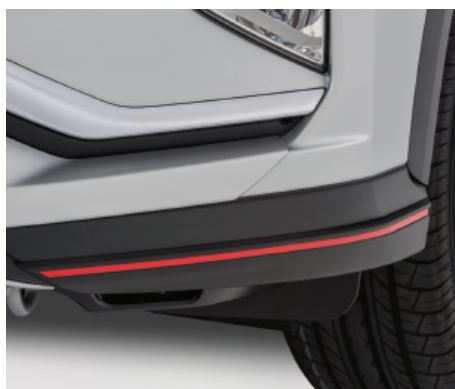
OZDOBNE NAROŻNIKI ZDERZAKA PRZEDNIEGO nr kat. MZ576674EX