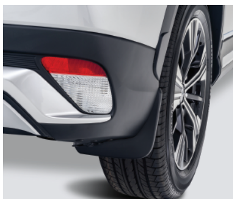
KPL. CHLAPACZY TYLNYCH nr kat. MZ531448EX