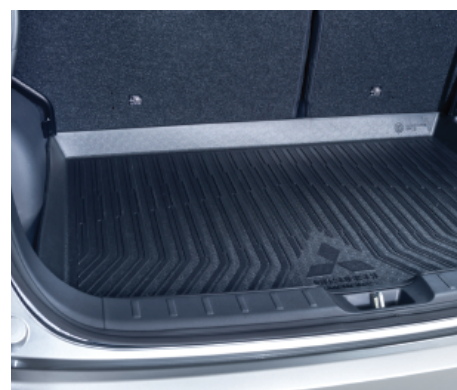
KUWETA BAGAŻNIKA nr kat. MZ314980