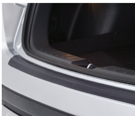
NAKŁADKA OCHRONNA ZDERZAKA TYLNEGO nr kat. MZ576679EX