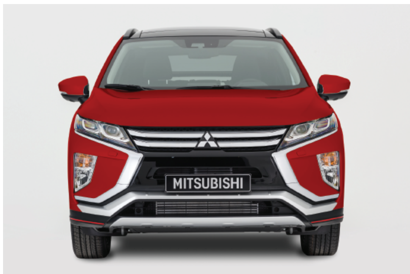
LISTWA OZDOBNA ZDERZAKA PRZEDNIEGO nr kat. MZ576673EX