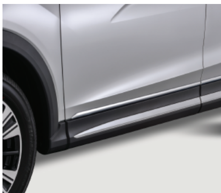
BOCZNE LISTWY OZDOBNE, CHROMOWANE nr kat. MZ538346EX