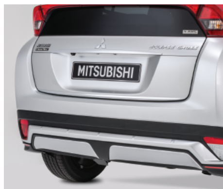
LISTWA OZDOBNA ZDERZAKA TYLNEGO nr kat. MZ576675EX