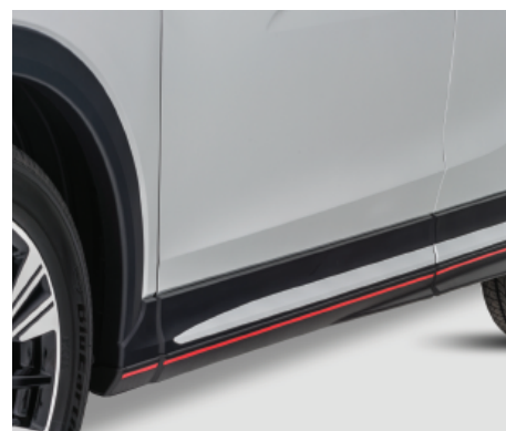
LISTWY PROGOWE nr kat. MZ576677EX