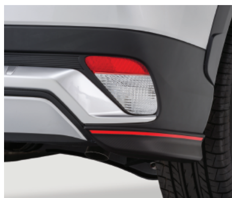
OZDOBNE NAROŻNIKI ZDERZAKA TYLNEGO nr kat. MZ576676EX