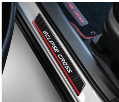
NAKŁADKI PROGOWE WZÓR "CARBON" nr kat. MZ315066