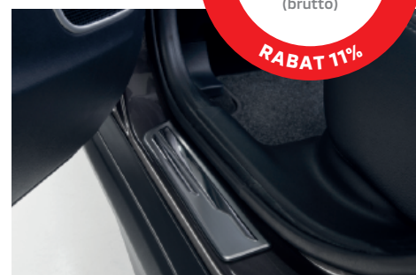
NAKŁADKI PROGOWE, STAL NIERDZEWNA