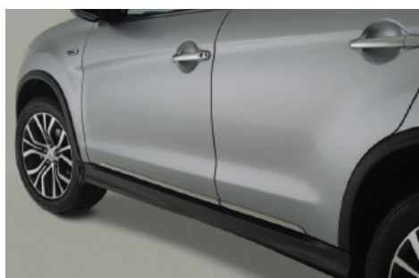
CHROMOWANE DOLNE LISTWY OZDOBNE