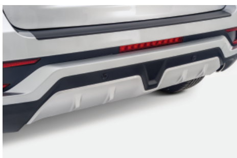
OSŁONA ZDERZAKA TYLNEGO