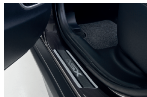
NAKŁADKI PROGOWE, SZARE