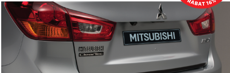
LISTWA POKRYWY BAGAŻNIKA, WZÓR CARBON

* do wersji bez kierunkowskazów w lusterkach