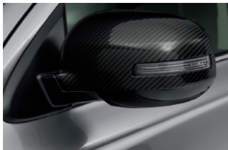
OSŁONY LUSTEREK ZEWNĘTRZNYCH, WZÓR CARBON