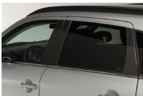
FOLIA DEKORACYJNA NA SŁUPKI B/C, WZÓR CARBON